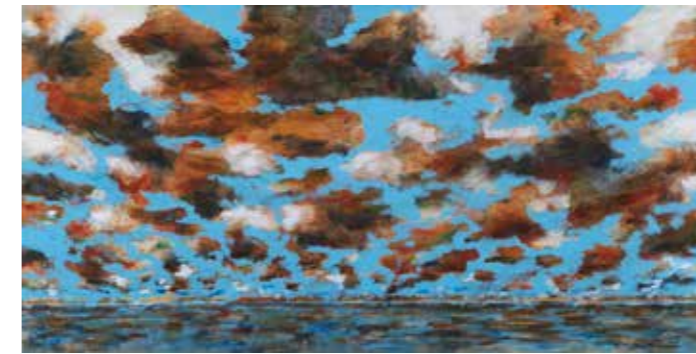
Johannes Gervé, Weit weg , 2013 Tempera op canvas 100 x 195 cm Verzameling Würth, inv. 16933

Nederland B.V. De 'vleugels' van de vier kinetische sculpturen worden aangedreven door de wind en bewegen op de kracht van de natuur. De 'windbruid' is een terugkerende titel van verschillende kunstwerken door de eeuwen heen, verwijzend naar de mythologie en synoniem aan 'wervelwind', zoals de sculptuur van Dieter Hacker (1985, inv. 3582) en Windsbraut (2003, inv. 8085) van Anselm Kiefer.