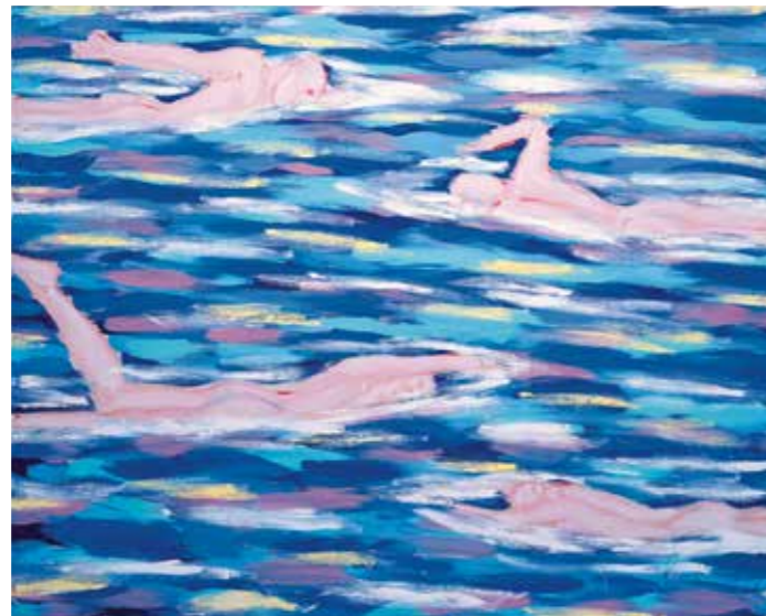
Salomé, Schwimmer , 1994 Acrylverf op neteldoek 160 x 200 cm Verzameling Würth, inv. 6786

Water kent verschillende vormen in de formatie van symbolen: in de mythologie, religie, filosofie, psychologie en kunst. Het wordt gerelateerd aan creatie en vernietiging, leven en dood, vruchtbaarheid en vergankelijkheid, alsook aan het onderbewustzijn.