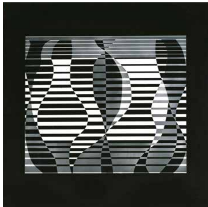
Josef Albers, In the water , 1935 Gecoat aluminium, gezandstraald 48 x 47 cm Verzameling Würth, inv. 2795

The wind, in all its manifestations, can reveal itself as a whirlwind and the clouds with their changing colour and direction, interacting with the water, are unique phenomena to be observed as depicted, for example, in Wolke by Kai Schiemenz (2005, inv. 9865) and Weit weg by Johannes Gervé (2013, inv. 16933). Clouds can also be seen in religious works of art, in which the image of God's appearance is depicted, for example.